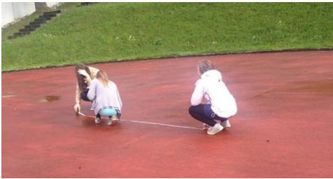
← Sie zeichnen das Spielfeld mit Kreide ein.

Wir gingen weiter zu dem roten Platz, wo drei andere Mädchen das Spielfeld vorzeichneten/vorbereiteten.