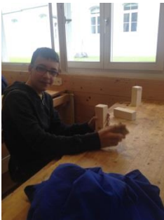
← Schüler beim Schleifen.

Im Werkraum wurde kräftig geschliffen. Die Schüler/innen mussten die Kubb-Klötze aufbessern.