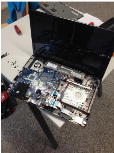
Ein Laptop von innen.

Die Schüler waren von Anfang an motiviert. Den Schülern in diesem Workshop stehen viele Werkzeuge zur Verfügung. Die Schüler lernen, wie eine Dampfmaschine funktioniert. Am Schluss mussten sie die Geräte wieder zusammenbauen.