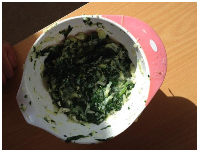
Füllung der tibetischen Momos

Engelberg – Heute konnte man bei Frau Scheuber selber Momos herstellen und sie im Anschluss auch gleich selber essen. Momos sind mit Fleisch gefüllte Teigtaschen.